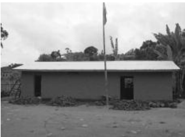
Ho an-dalam-pamaranana ny ivon-toerana ho an'ny vehivavy ao Ambolomadinika

Anisan'ireo tanjona lehibe amin'ny fanatanterahana ny tetik'asa fiahiana ara-tsakafo izay sahanin'ny ONG Tandavanala ny fananganana ivon-toerana ao amin'ny Kaominina Ambolomadinika, Distrikan'Ikongo ka iarahamiasa indrindra amin'ireo Vondron'Olona Ifotony sy ny fikambanam-behivavy ao an-toerana. Araka izany dia natomboka tamin'ny fiantombohan'ny volana Aogositra ny asa fananganana.