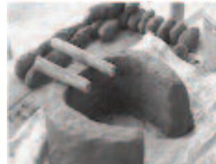
6. Esorina ny vilany ka asiana bararata 2, atao mahitsy tsara mifanandrify amin'ny varavarana. Atao ho fivoahan'ny setroka