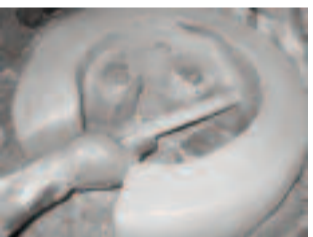
8. Rehefa vita rafitra tsara ny fatana dia esorina amin'izay ny bararata 2 natao hivoahan'ny setroka dia alamaina tsara ny manodidina