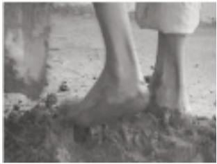
3. Hitsakitsahina mba hifangaro tsara ny akora rehetra