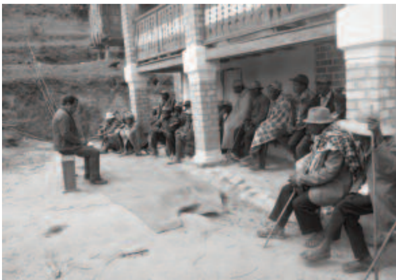
Fampiofanana ireo Vondron'Olona Ifotony ho fampahafantarana ny tetik'asa REDD+ tao Andranomiditra

Ny tetikasa REDD+ dia azo lazaina tsotra amin'ny fahafahan'ny ala mitroka ny enton'arina izay sandaina