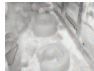
9. Rehefa vita ny fatana dia apetraka amin'ny toerana maloka mandritra ny folo andro mba ho maina tsara izay vao azo ampiasaina.