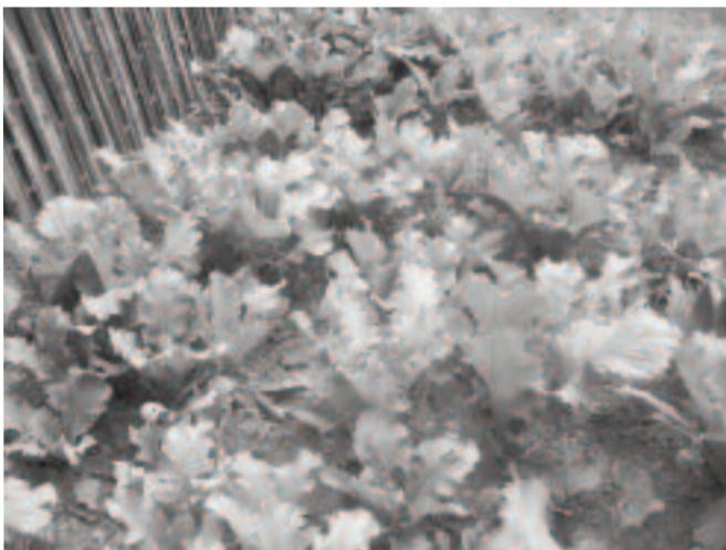
Vokatra petsay ao Antsatrana - Ikongo