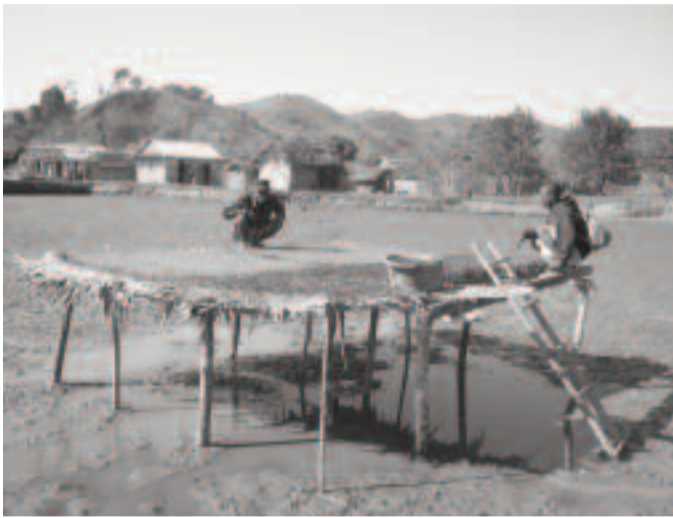
Fambolem-bary ara tekinika ao Antsatrana - Ikongo

tantsaha mampihatra ny voly vary nohatsaraina. Nahitana vokatra ihany koa ny fambolena voatabia ary misy ny manaraka antsakany sy andavany ny tekinika nampianarina ka nahazo vokatra tsara tamin'ity taona 2013 ity. Tao amin'ny Fokontany Antsatrana dia ahazoana voatabia 03 kilao ny iray fototra ary misy tokantrano mihoatra ny 30 efa mahazo ambonin'izany. Ny fambolena anana hafa moa dia hita fa efa misy fiantraikany amin'ny fari-piainan'ny tantsaha ka mampidi-bola ho azy ireo. Masomboly petsay iray fonosana dia mety ahazoana vola 50 000 ar (dimy alina ariary) araka ny voalazan'ny tantsaha iray tao Antsatrana . Efa miroso