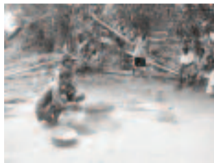
1. Ampifangaroana ny tany manga, ny tany mena, ny lavenona ary ny mololo efa voatapatapaka tsara.